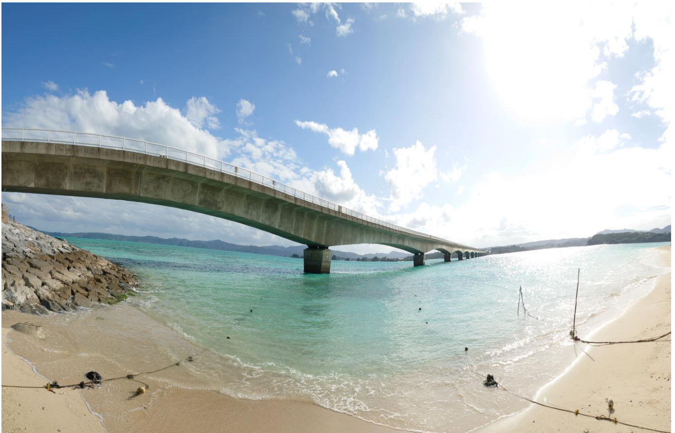
～古宇利大橋と海（沖縄）～